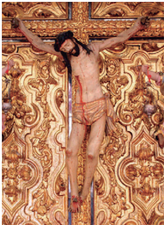
Fig. 8. Crucificado llamado del Amor. Osuna. Foto 14

ceso se llevaron a cabo en la escultura exámenes y análisis con diversas técnicas: estudio fotográfico con luz normal y ultravioleta, examen radiográfico, estudio biológico para la identificación de la madera, caracterización de los materiales constitutivos de la superficie policroma y estudio de ataques biológicos.