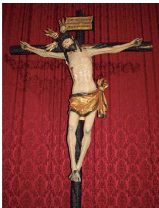
Fig.1. Cristo de la Amargura.

Como ya hemos adelantado arriba, el Cristo de la Amargura supuso a principios de los años noventa