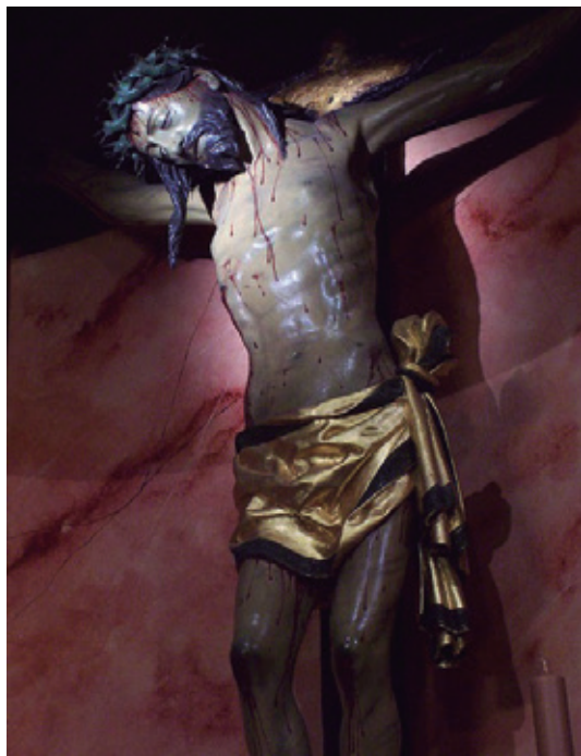
Fig. 4. Cristo del Perdón. La Puebla del Río.

vento de las RR.MM. dominicas de Jaén y que procedía de un desaparecido convento de la ciudad de Córdoba 8 . Los autores del estudio que establece la atribución lo sitúan cronológicamente en un amplio período que va de 1510 a 1520. (fig. 4)