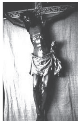
Fig. 5. Crucificado RR.MM. dominicas. Jaén.