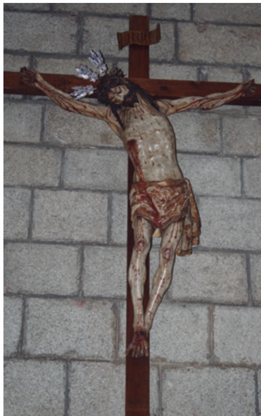
Fig. 7. Cristo del Perdón. Fregenal de la Sierra.

Por último, en 2018, el profesor José Roda Peña presenta la atribución a la gubia del genial maestro del Crucificado del Amor del monasterio de mercedarias descalzas de la Encarnación de Osuna, tomando como referencia su parecido con el de la Amargura, aunque el de Osuna de unas dimensiones similares al Santísimo Cristo de la Antigua de Espera, un metro aproximadamente 13 .