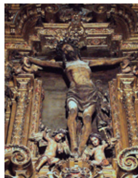
Fig. 3. Crucificado de la Concepción Grande. Catedral de Sevilla.

A partir de la autorización del Cristo de la Amargura de Carmona y del de la Viga de Lebrija, surgen varias atribuciones muy acertadas que amplían el repertorio de crucificados del taller de Jorge Fernández. El profesor Emilio Gómez Piñol incluye la colosal imagen del Crucificado de la Concepción Grande de la Catedral de Sevilla 7 . Llama la atención en esta escultura, además de su carácter monumental, la plasticidad en el tratamiento de su sudario. (fig. 3)