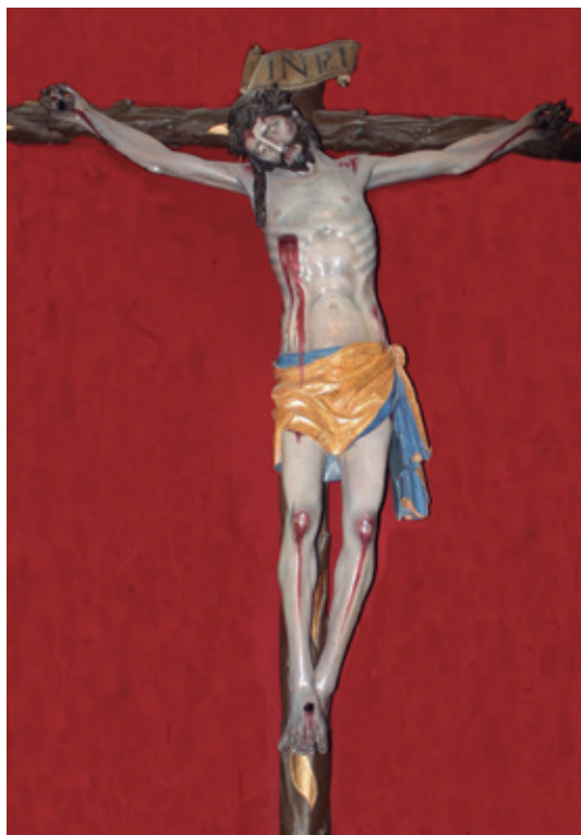
Fig. 2. Cristo de la Viga. Lebrija.

En 1998 se publicaron descargos de la fábrica de la parroquia de Santa María de la Oliva de Lebrija procedentes de su archivo que permitieron añadir al catálogo documentado del «insigne escultor» el Cristo de la Viga que se conserva actualmente en el museo parroquial de dicho templo 4 . Esta valio-