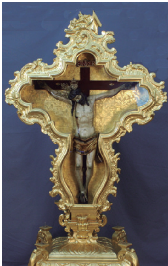
Fig. 6. Santísimo Cristo de la Antigua. Espera.