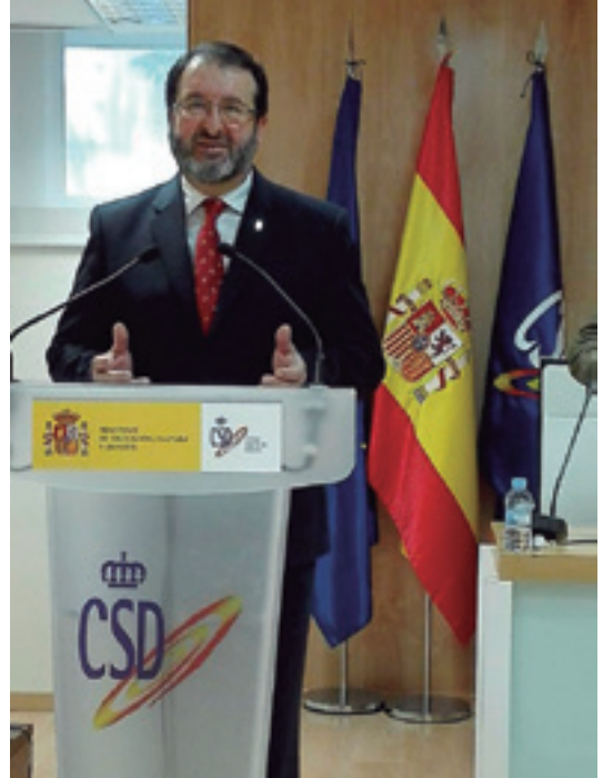
Consejo Superior de Deportes, presentación de la candidatura al Campeonato de España de Doma Vaquera 2017

Es un orgullo contar con entidades como la Hermandad de San Felipe que trabajan sin descanso por hacer de Carmona una ciudad mejor. Y aquí sumo